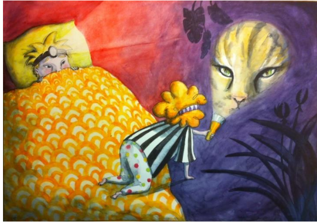
Illustration: Johanna Rehn